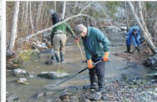
Virtaveitalkoissa kunnostettiin viikonloppuna Sastamalan Rautajokea, jonka pohjalle lletettiin soraa taimenien kutupaikaksi.